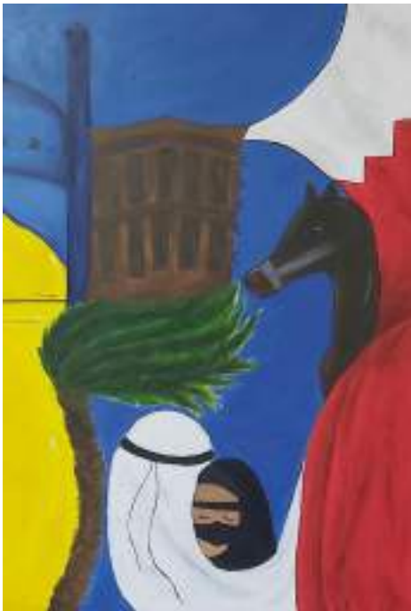
Fatima Abbas Husain Grade 7