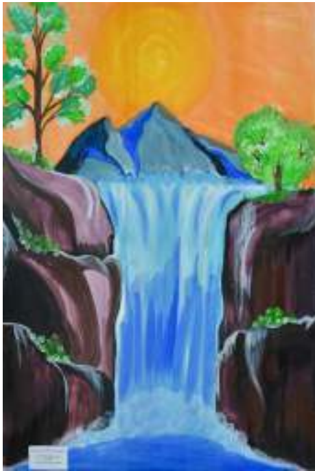
Rashed Mohamed Ismaeel Grade 3